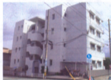
コレマツハイツ藤崎 平成20年4月12日完成